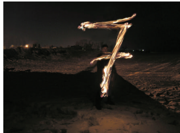
«БЕЗ НАЗВАНИЯ» 2005. Фотоинсталляция