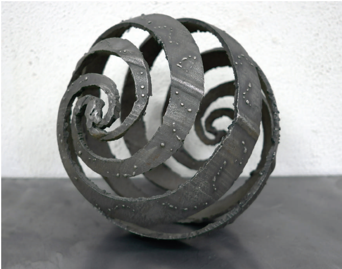
«СФЕРА» 2001. Сталь, флуоресцентная краска, 40x40x40