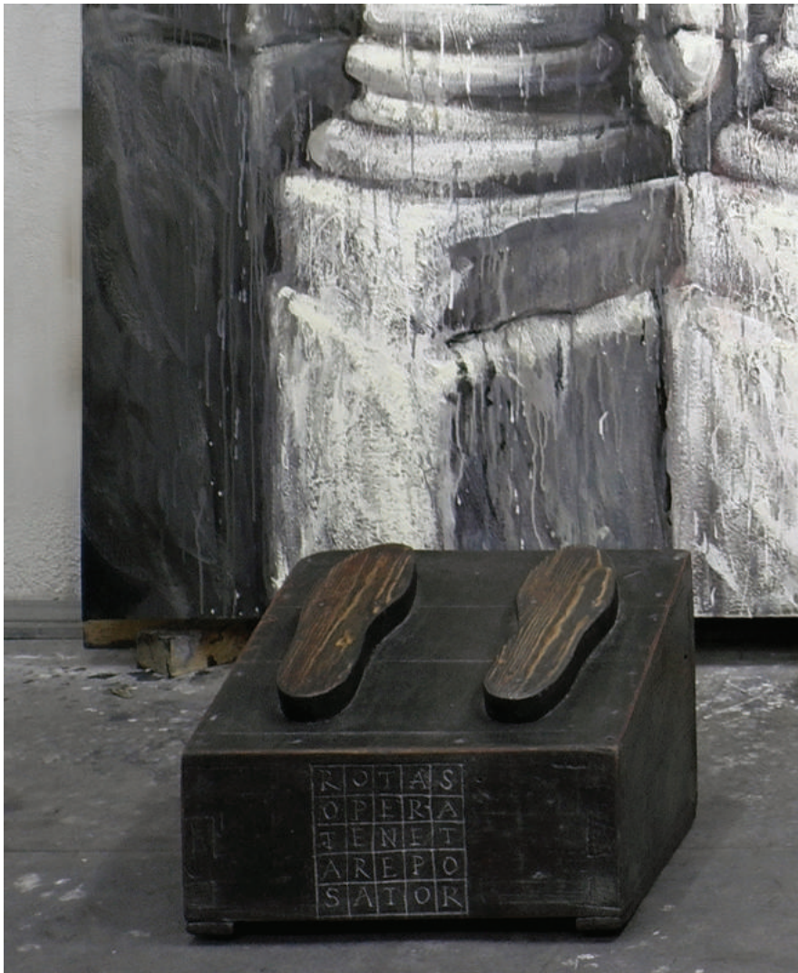
«АРМЕЙСКАЯ ПОДСТАВКА ДЛЯ ЧИСТКИ ОБУВИ» 2014. Реди-мейд, 30x38x40