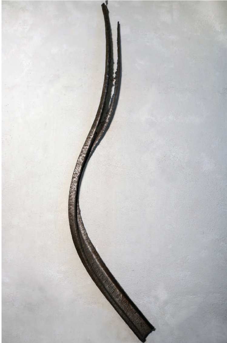
«РАСПЛАВЛЕННАЯ РЕЛЬСА» 2003. Реди-мейд, 270x40