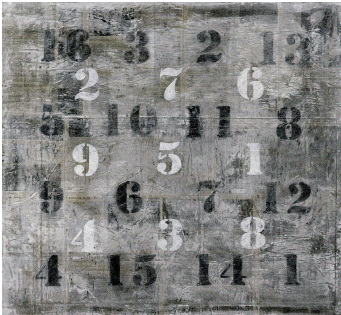
«БЕЛЫЙ И ЧЕРНЫЙ ЧИСЛОВОЙ КВАДРАТ» 2012. Фанера/акрил, эмаль, трафаретная печать. 100x100