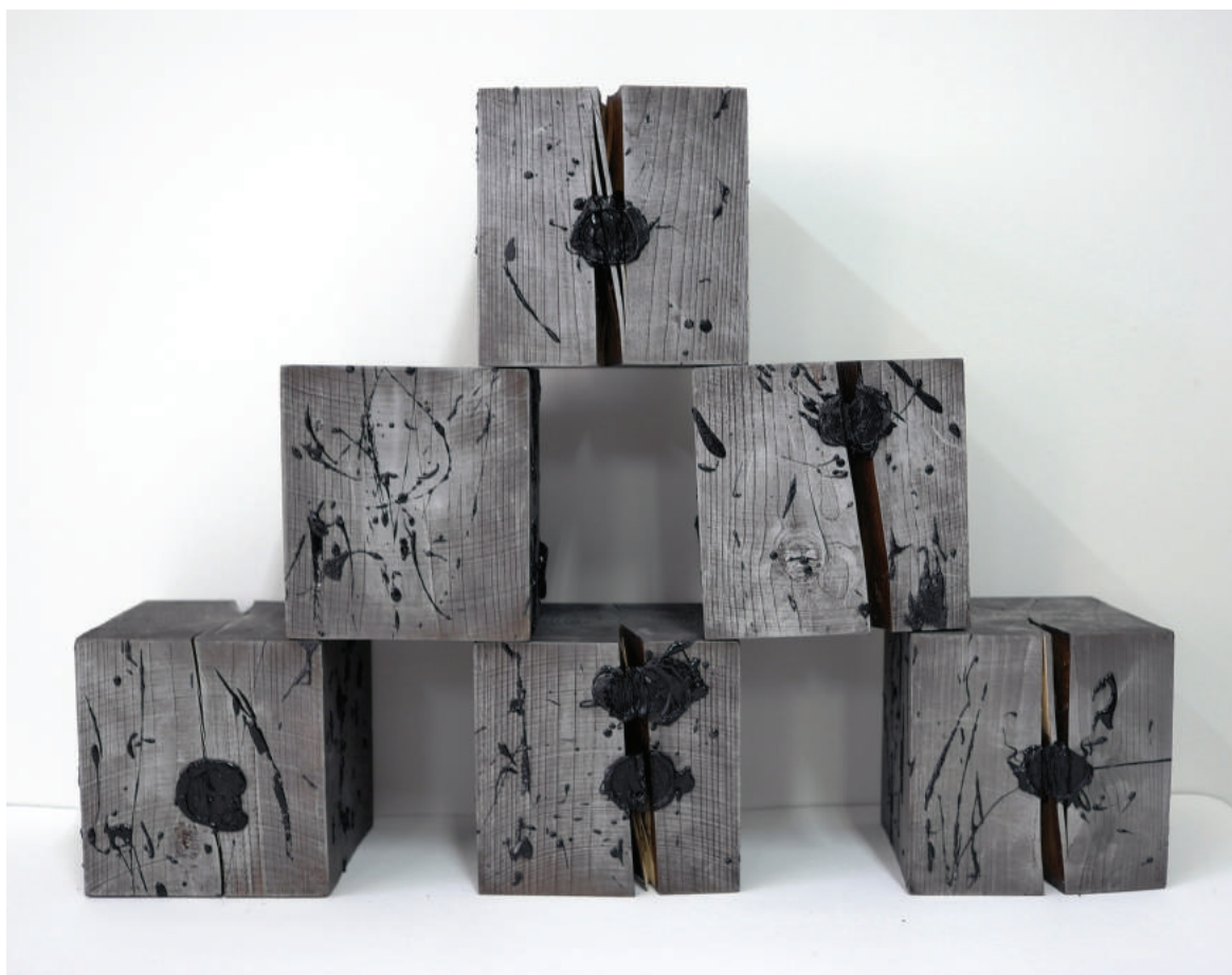
«ЭХО СОЛНЕЧНЫХ БУРЬ» 1999. Печатные формы, дерево, сургуч, графит, 19x19x19