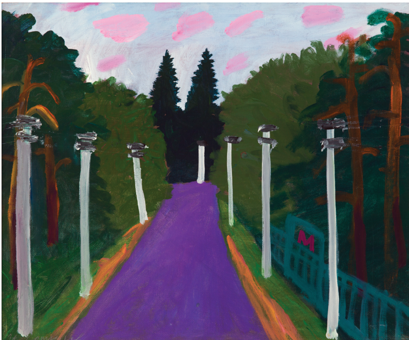
«УЛИЦА КИРОВА, ПОСЁЛОК ВЫРИЦА»