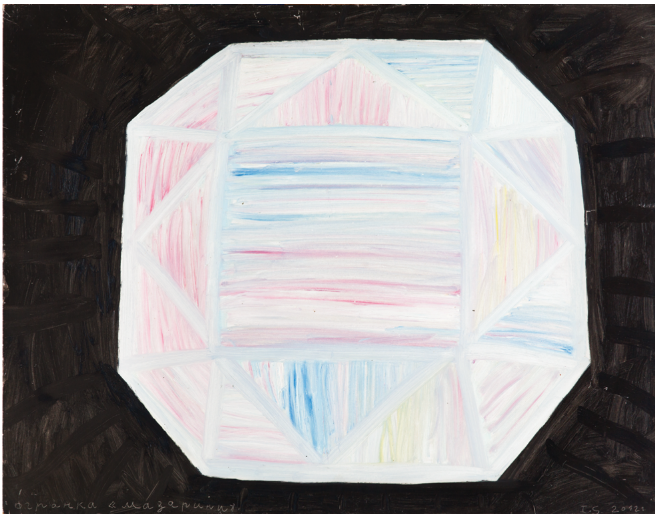
«ОГРАНКА «МАЗАРИНИ». ИЗ СЕРИИ «ПОЛНАЯ ОГРАНКА»