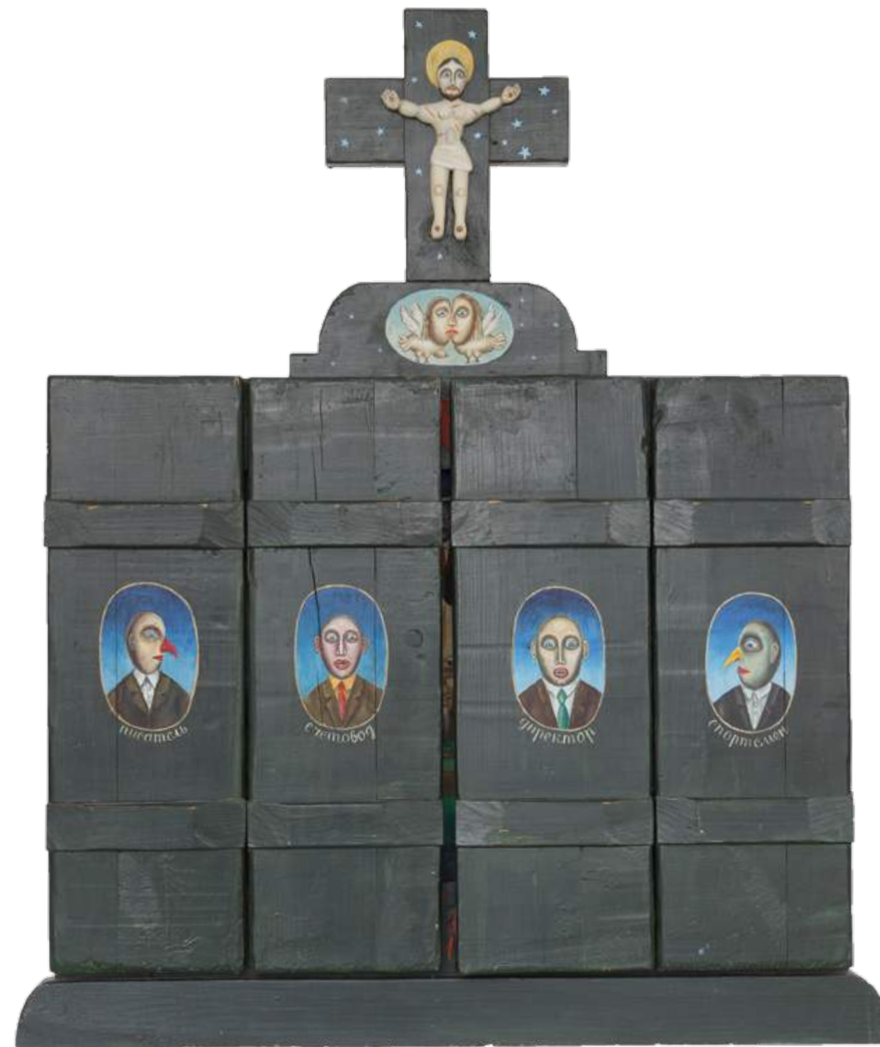
«И УВИДЕЛ Я В СТРАДАНИЯХ» 1986. Дерево/смешанная техника. Размер в закрытом виде — 105x80 см, в раскрытом — 105x159 см

Неслучайно работы художника сравнивают с творениями Иеронима Босха и других мастеров Северного Возрождения. Композиционно они действительно близки. В них есть иерархия в виде доминирующей центральной оси, вокруг которой разво-