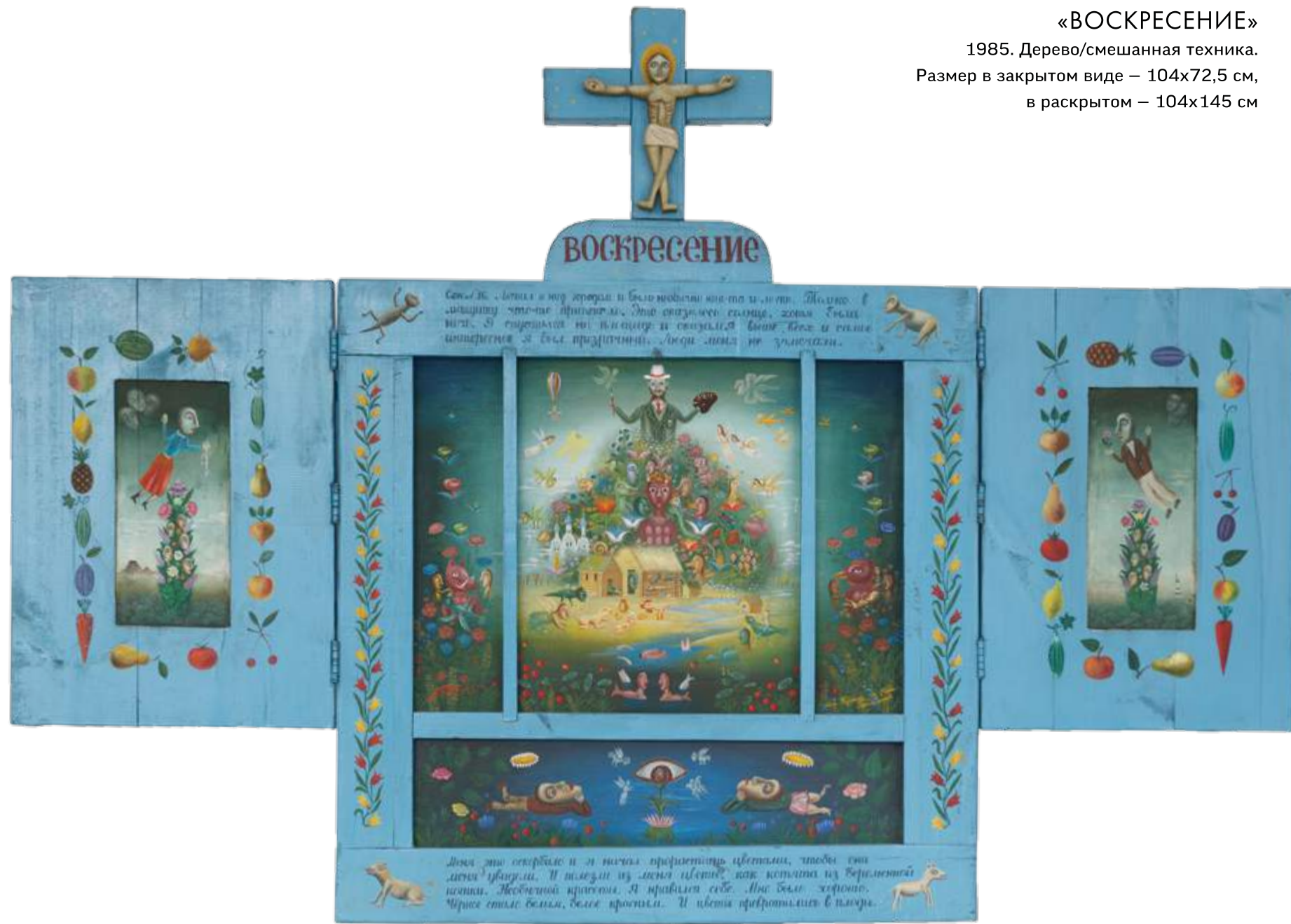
«ВОСКРЕСЕНИЕ» 1985. Дерево/смешанная техника. Размер в закрытом виде – 104x72,5 см, в раскрытом – 104x145 см