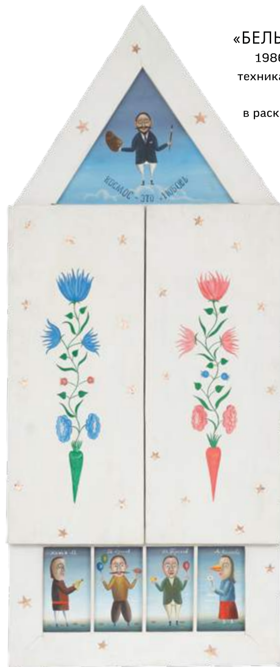
«БЕЛЫЙ СКЛАДЕНЬ» 1986. Дерево/смешанная техника. Размер в закрытом виде – 159х65,5 см, в раскрытом – 159х132 см